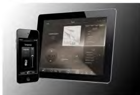
_sistemi da visualizzazione e gestione remota.