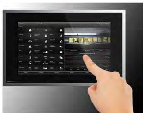
_touch wireless da parete o da appoggio.