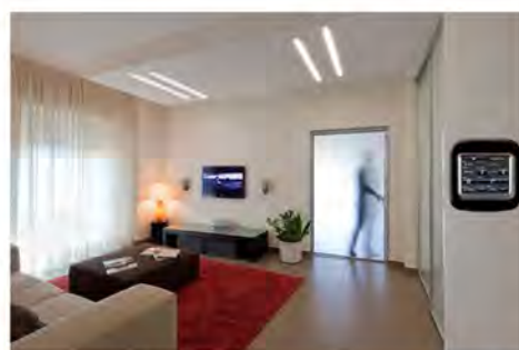
_touch parziale da parete.